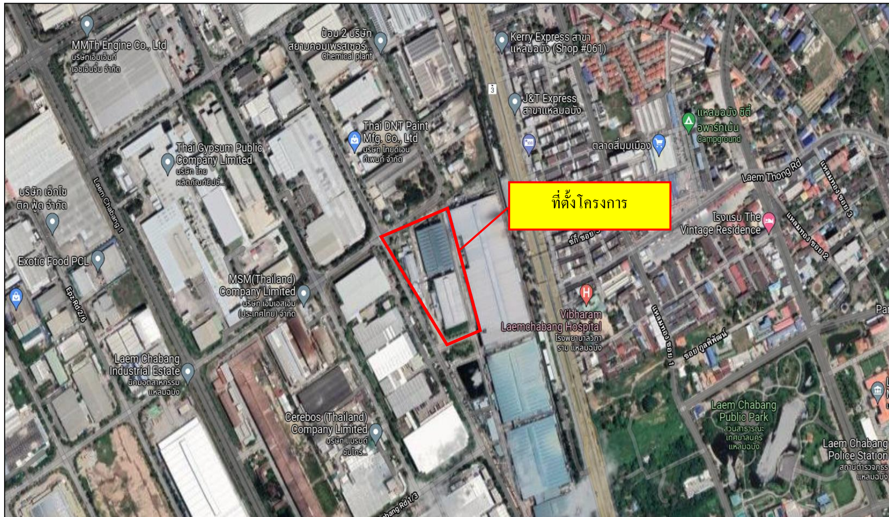
ภาพที่ 1.1 แผนที่แสดงที่ตั้งโครงการ